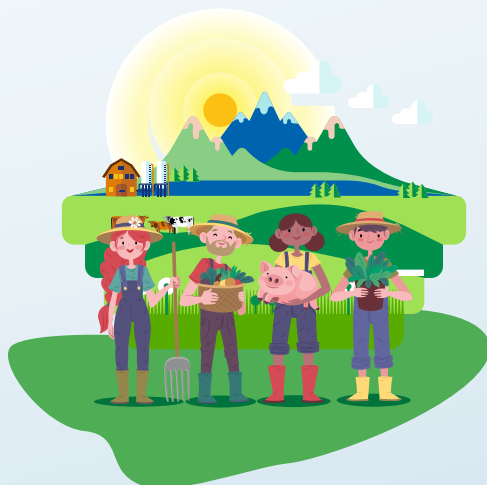
Ilustração: Roselande Silva Marques de Sá